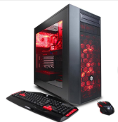
1 pc vr ready