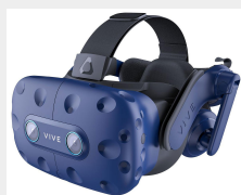
1 casque vr HTC Vive